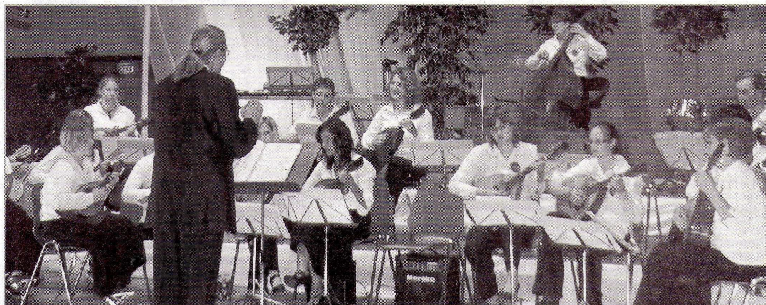
L'orchestre de mandoline de Remiremont a offert un concert d'une qualité remarquable.