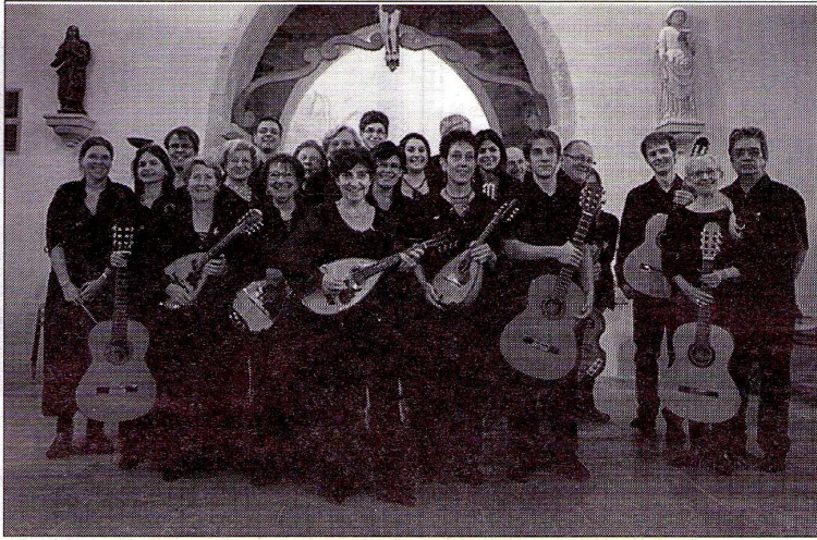
Estudiantina de Roanne