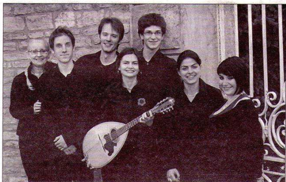
Grupetto de l'Estudiantina de Roanne