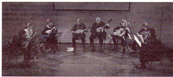
Pizzicatis de Paris

C'est hier, jeudi, qu'ont débuté ces deuxièmes rencontres nationales d'orchestres 'à plectres'. Les orchestres à plectres sont des orchestres composés par des mandolines, guitares, mandoles et mandolincelles.